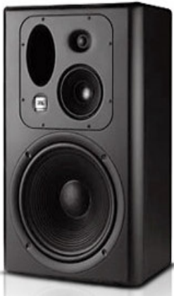
JBL LSR (passiva)