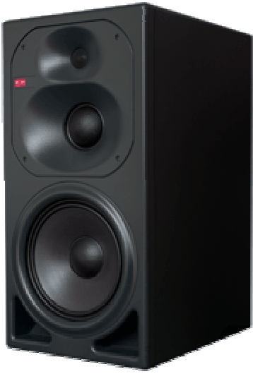
Klein & Hummel 0410