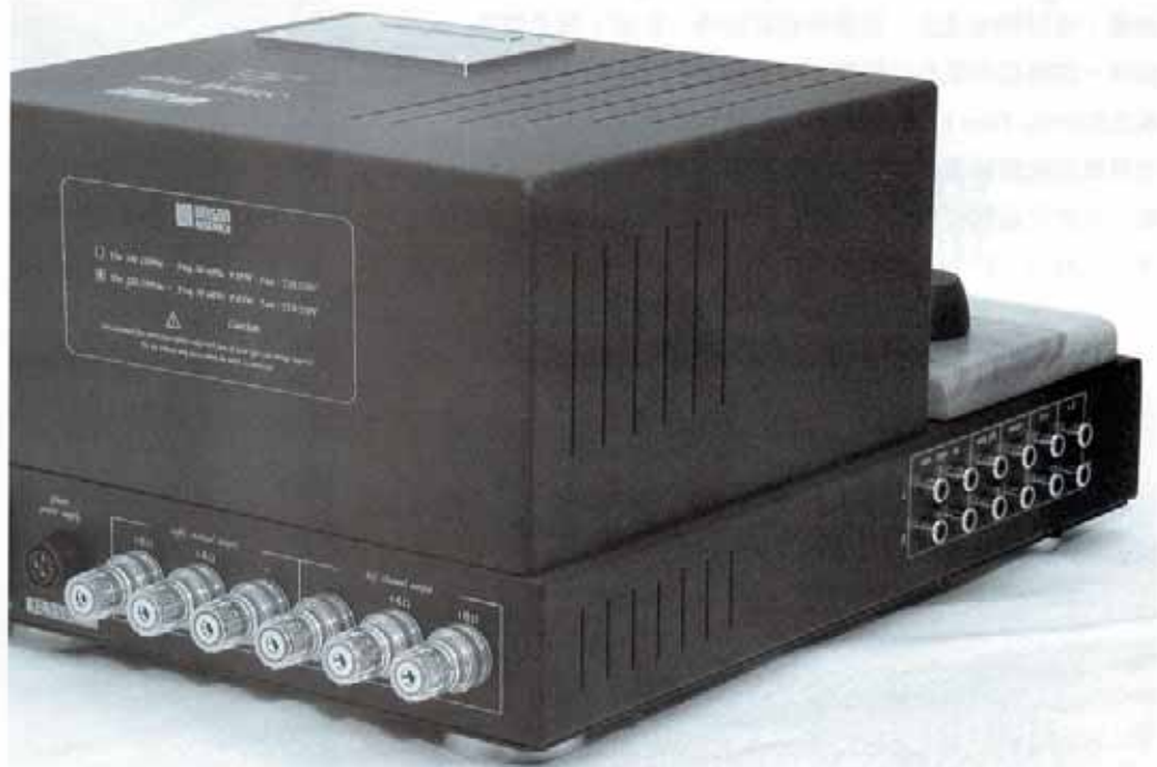
△ 輸入插座設於左側可大大減少及縮短內部接線的長度

3) 控制力好。Simply Two LE 的聚焦力線條感好極，人聲樂器線條分明，分隔度好，毫不含糊。它的中低頻表現才更見高水準，以其 10W 的純 A 功率輸出力量便能將每聲道用上兩隻低音單元的 Performance 6 控制得貼服，使得中低頻凝聚受控、快速結實、中低頻上一帶表現得非常平順，低頻深潛向下不輕浮吊腳。播《Audiophile Test CD 2005》第 12 首「So what」，大牛筋表現出很好的彈力體形圓渾結實，在最強勁時