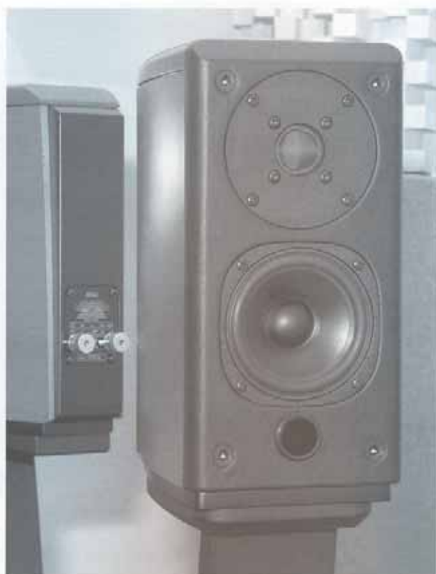
△ Opera Mini的試音報告將於下期奉上。

Simply Two LE是一部非常出色的動聽製作，也許它跟S2KR的不同在於更清通、細緻、聚焦、輕快、與較豐厚、大力的分別，買家不妨詳細比較一下。始終，Simply Two LE是不可多得，再加上其限量製作顯得更矚貴，我高度推薦。◀HIFI